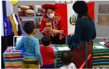
(Hình ảnh lễ hội năm trước)

Thời gian: ngày 24 tháng 10 (chủ nhật) 10 giờ sáng ~ 4 giờ chiều Địa điểm: Hội quán giao lưu quốc tế tỉnh Fukui