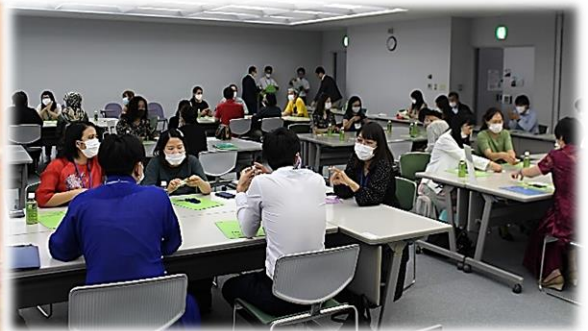
【Hình ảnh lễ ủy thác và buổi huấn luyện】