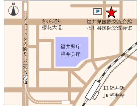
【交通】从 JR “福井” 站徒步约 10 分钟