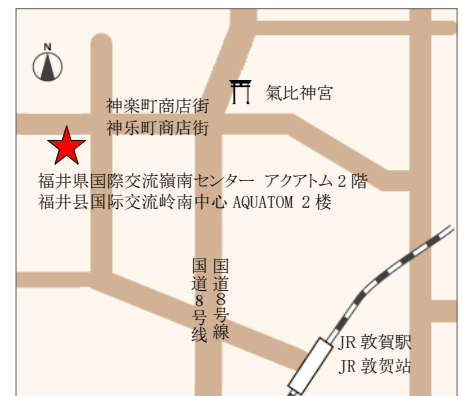
【交通】从 JR “敦贺” 站徒步约 20 分钟

如果从 JR 敦贺站乘坐巴士前来, 请乘坐②④⑤⑧⑩⑬⑭号巴士, 在“神乐町”下车, 或乘坐⑫号巴士在“敦贺儿童公园”下车。