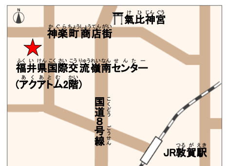
交通アクセス JR「敦賀」駅から徒歩で約20分

Tel 0770-21-3455 Fax 0770-21-3441 Email reinan@f-i-a.or.jp