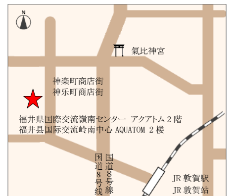
【交通】从 JR “敦贺” 站徒步约 20 分钟

如果从 JR 敦贺站乘坐巴士前来, 请乘坐②④⑤⑧⑩⑬⑭号巴士, 在“神乐町”下车, 或乘坐⑫号巴士在“敦贺儿童公园”下车。