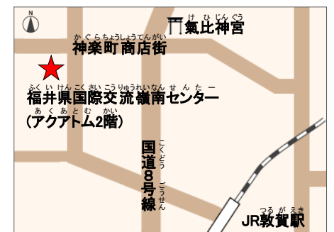
交通アクセス> JR敦賀駅から徒歩で約20分

Tel 0770-21-3455 Fax 0770-21-3441 Email reinan@f-i-a.or.jp