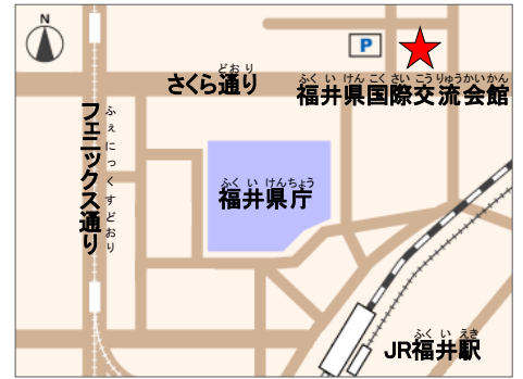
交通アクセス> JR福井駅から徒歩で約10分

Tel 0776-28-8800 Fax 0776-28-8818 Email info@f-i-a.or.jp