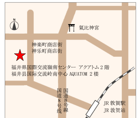
【交通】从JR敦贺站徒步约20分钟

如果从JR敦贺站乘坐巴士前来, 请乘坐②④⑤⑧⑩⑬⑭号巴士, 在“神乐町”下车, 或乘坐⑫号巴士在“敦贺儿童公园”下车。