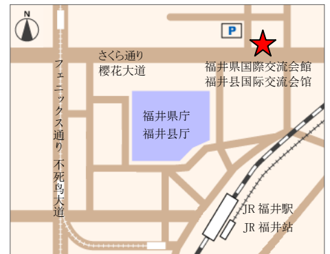
【交通】从JR福井站徒步约10分钟