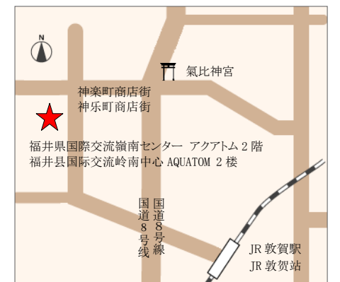
【交通】从JR敦贺站徒步约20分钟

如果从JR敦贺站乘坐巴士前来, 请乘坐②④⑤⑧⑩⑬⑭号巴士, 在“神乐町”下车, 或乘坐⑫号巴士在“敦贺儿童公园”下车。