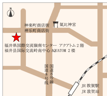
【交通】从 JR 敦贺站徒步约 20 分钟

如果从 JR 敦贺站乘坐巴士前来, 请乘坐②④⑤⑧⑩号巴士, 在“神乐町”下车, 或乘坐⑫号巴士在“敦贺儿童公园”下车。