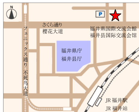
【交通】从 JR 福井站徒步约 10 分钟