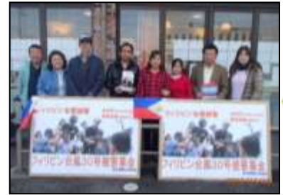
- 活動の様子 - 高浜国際交流協会の皆さん (平成25年11月26日)

高浜国際交流協会をはじめ県民の皆様から合計218,520円の義援金が寄せられ、2013年12月26日に公益財団法人日本ユニセフ協会に届けました。今後は、同団体を通じて被災地の緊急支援活動等に生かされます。皆様のご好意に厚くお礼申し上げますとともに、被災地の一日も早い復旧をお祈りいたします。