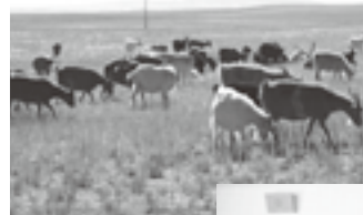
モンゴルの大草原