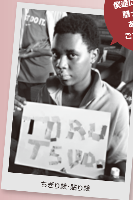
ちぎり絵・貼り絵