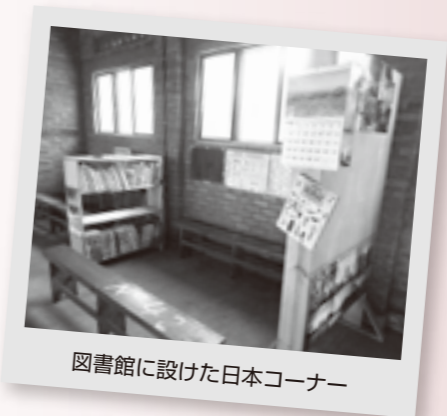
図書館に設けた日本コーナー