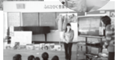
モンゴルの文化紹介