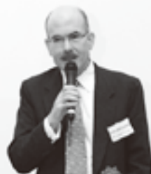
ジェームズ・P・ズムワルト 米国大使館首席公使の基調講演