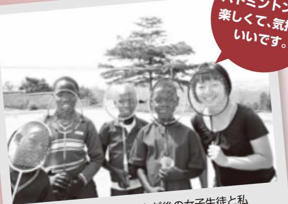
バドミントンを楽しんだ後の女子生徒と私