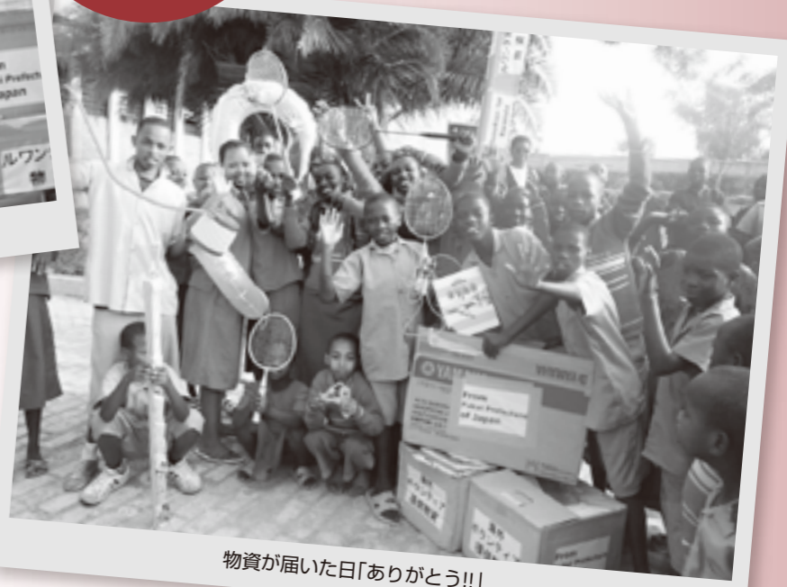
物資が届いた日「ありがとう!!」