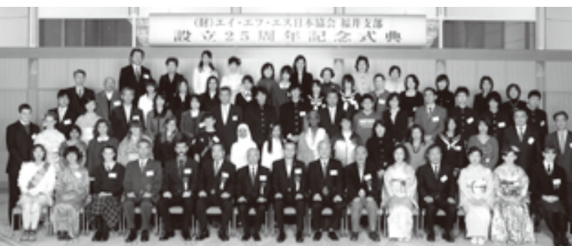
AFS日本協会福井支部設立25周年記念式典

このような交流は、ホストファミリーと地元の皆様の温かいご支援に支えられて初めて成功するものです。どなたでも入会できますので、是非一度ホストファミリーを体験してみてください。AFSファミリーとして、外国にもう一人の子どもができ、国際交流の輪が広がります。