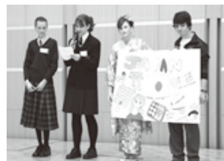
AFS生のプレゼンテーション「ジャパン」