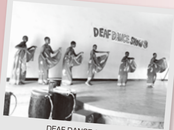
DEAF DANCE SHOW