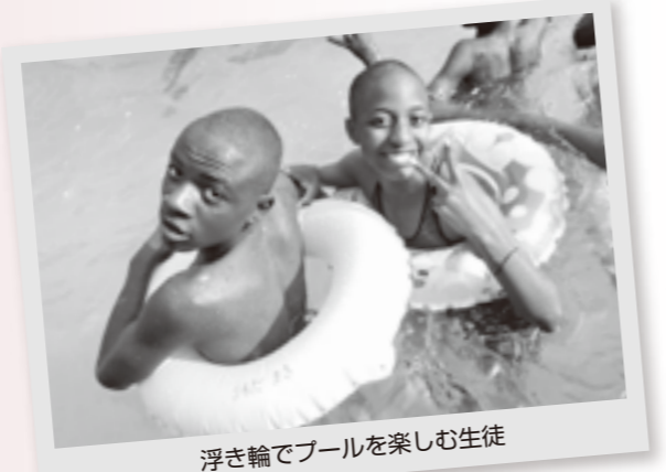
浮き輪でプールを楽しむ生徒