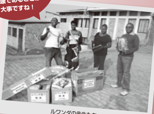
ルワンダの先生たち

ルワンダでも スポーツを 重視し始めた今、生徒が 楽しむスポーツの種類が 増えて嬉しいです。 スポーツを通して、 健康であることは 大事ですね！