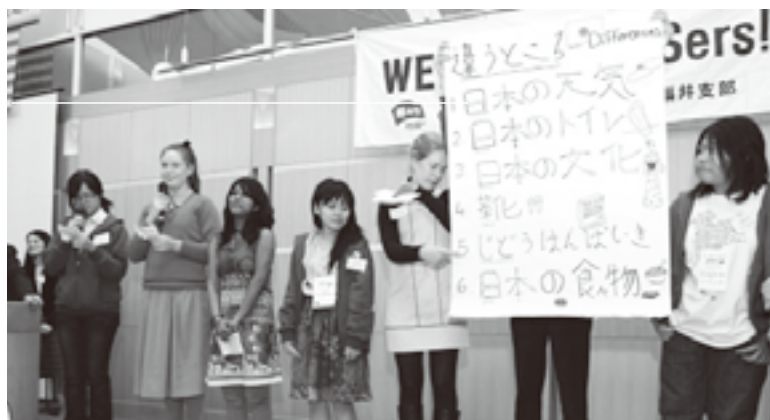
オーストラリア人から見た日本文化の特徴

公益財団法人AFS日本協会は、ニューヨークを中心に、世界約80か国の間で年間12,000人を越える高校生の交換留学事業を行っているボランティア団体です。感受性豊かな高校生が充実した異文化体験をできるように、社会人・教師・ボランティアなど幅広い年齢層の人々が交換留学を支援しています。